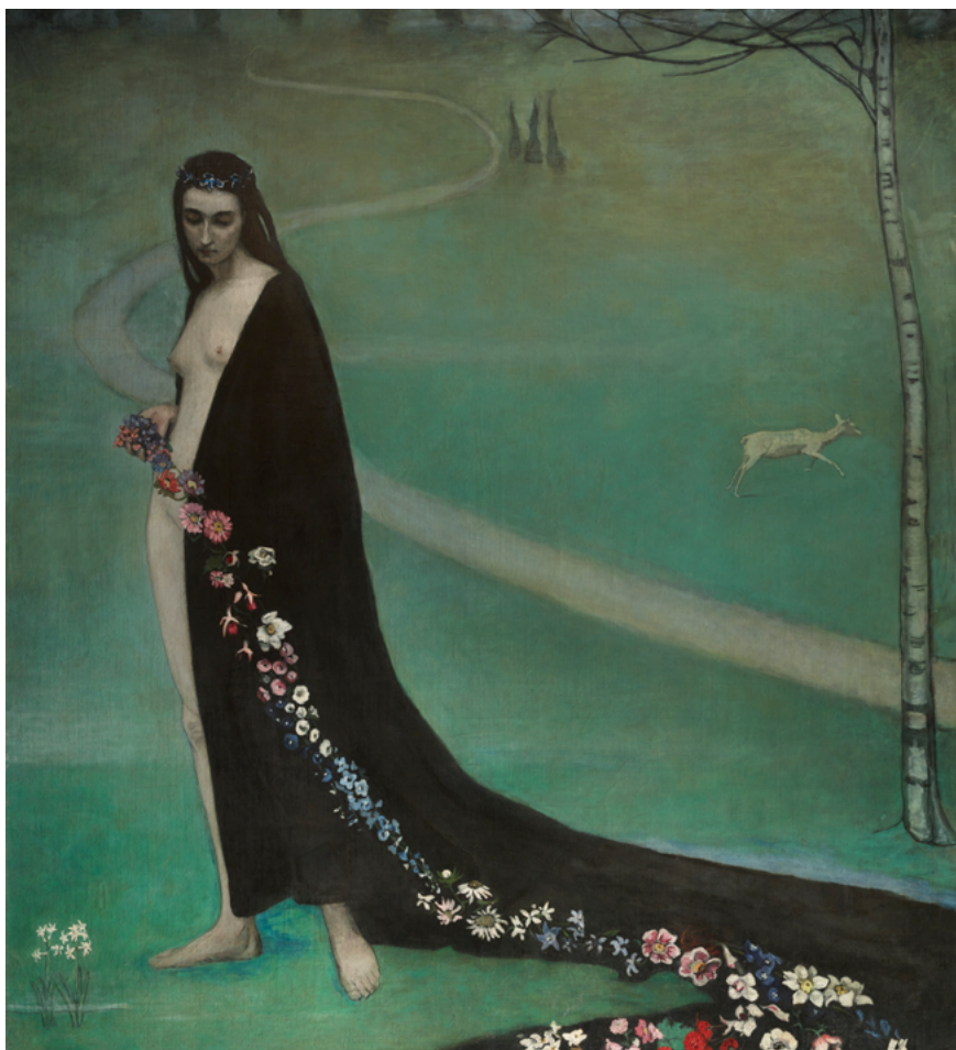
Romaine Brooks (1874-1970), Le Printemps , 1911-1913