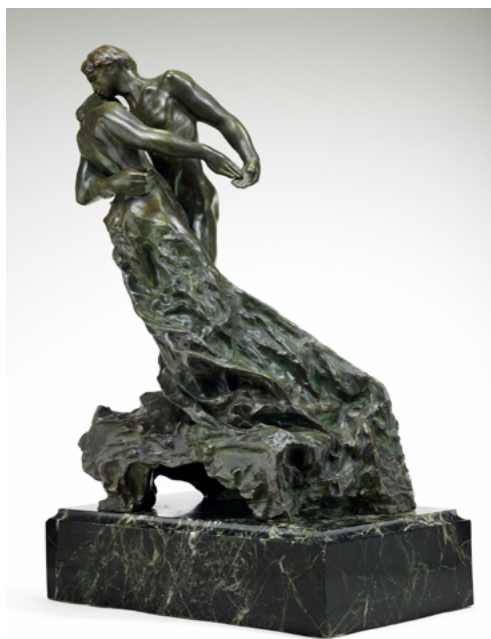
Camille Claudel (1856-1943), La Valse , 1905

Cette exposition présente une collection privée qui réunit une sélection exceptionnelle de peintures, sculptures, dessins, lithographies et objets d'art d'une cinquantaine d'artistes français ou étrangers, qui vivaient et travaillaient en France entre 1890 et 1914 et appartenaient à deux générations du mouvement symboliste français et européen.